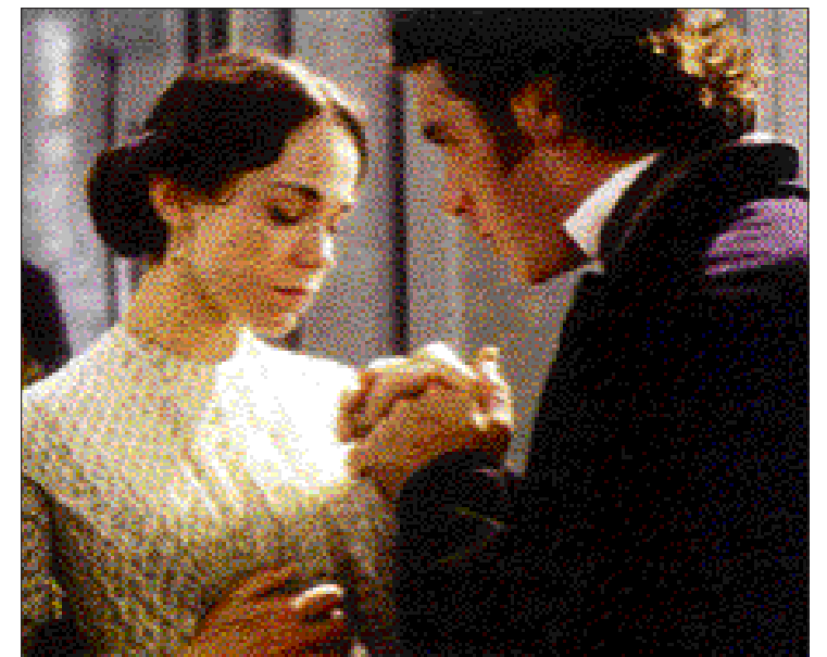
Frances O'Connor als Emma Bovary in de gelijknamige BBC-productie uit 2000, een van de beste van tien bestaande filmversies van de roman, op een dubbel-dvd verkrijgbaar.